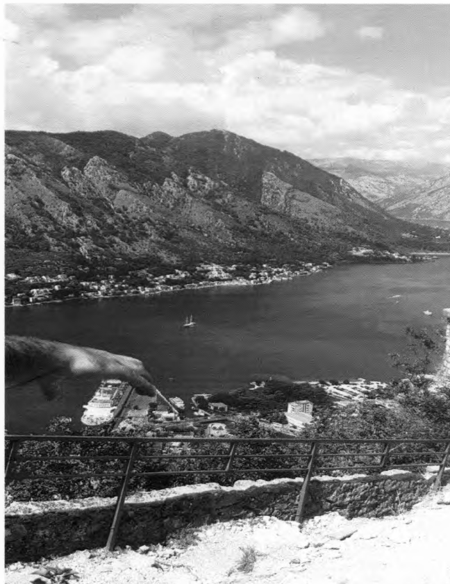
Slika 3: Kud plovi ovaj brod?